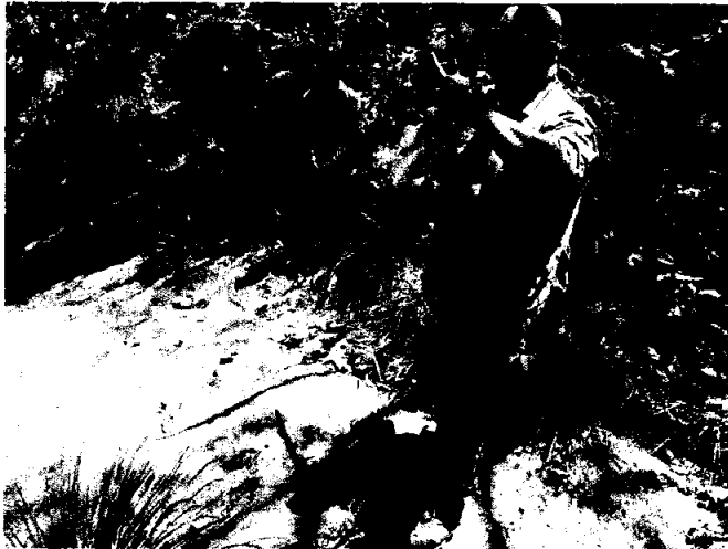
Fig 5.- Platica con pobladores locales en áreas donde se pidió el apoyo para atención a conflicto humano-depredador