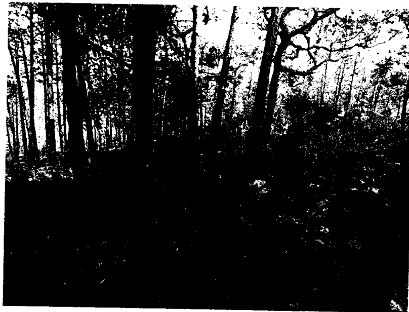
Fig 3.- Apoyo a UMA de Guadalupe Ocotán en atención a la problemática con cazadores, los cuales fueron retirados del área por no contar los permisos legales correspondientes.