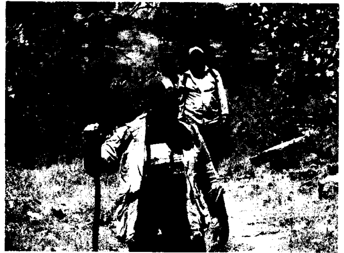
Fig 5.- Visita de campo con pobladores locales en áreas donde se pidió el apoyo para atención a conflicto humano-depredador