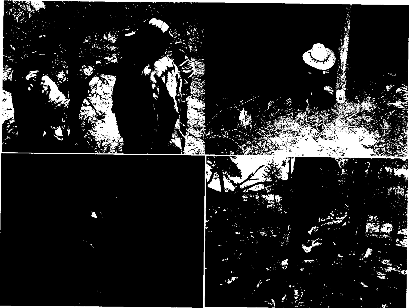
Fig 1.- Revisión y colocación de cámaras trampa en las áreas de monitoreo ambiental, en compañía de las personas de la comunidad, quienes fueron capacitadas para la revisión y colocación del equipo.