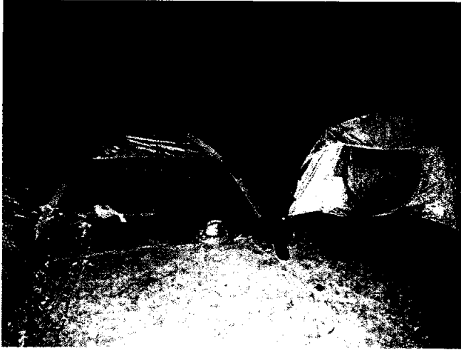
Fig 4.- Utilización del material para acampar en la sierra de pajaritos.