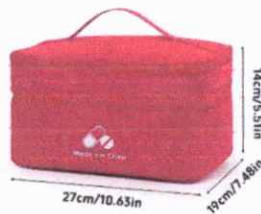
MOCHILA BOTIQUIN (IMAGEN DE REFERENCIA Y MEDIDAS APROXIMADAS)

Handwritten signatures and marks on the right side of the page.