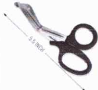
TIJERA PARA TRAUMA