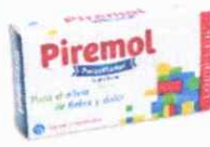
PARACETAMOL SUPOSITARIO INF